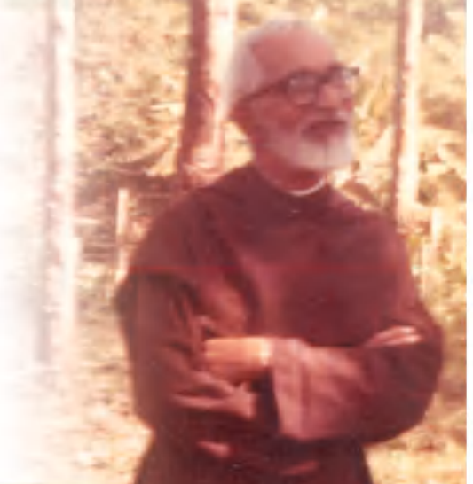
1-ാം പേജിൽ നിന്നും തുടർച്ച