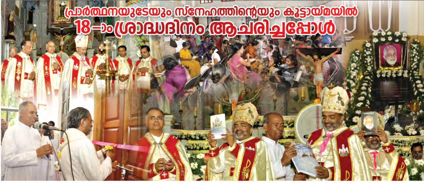
3-ാം പേജിൽ ഒന്നാം കോളം