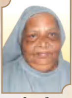
സി. ട്രീസ പറോക്കാൻ C.H.F.