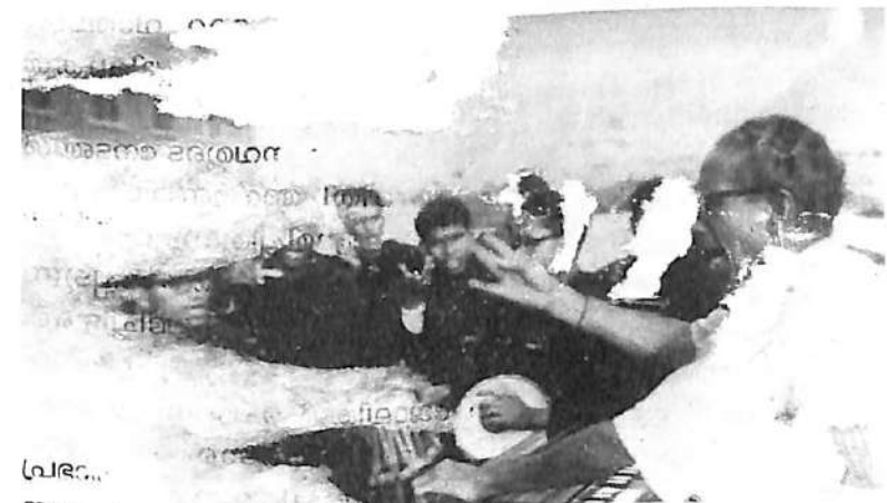
പ്രഭു... സമൂഹത്തെ അറിയിക്കുക എന്ന രീതിയിൽ പാരിതോഷികങ്ങൾ നൽകി അവരെ ആശ്വസിപ്പിക്കാൻ മഹാനുഭവ വിശുദ്ധനുമായ അദ്ദേഹത്താൽ ആദരിക്കപ്പെടുന്നതിനും ഉദ്ദേശിച്ചിരുന്നു. എനിക്കും ഭാഗ്യം ലഭിച്ചു.